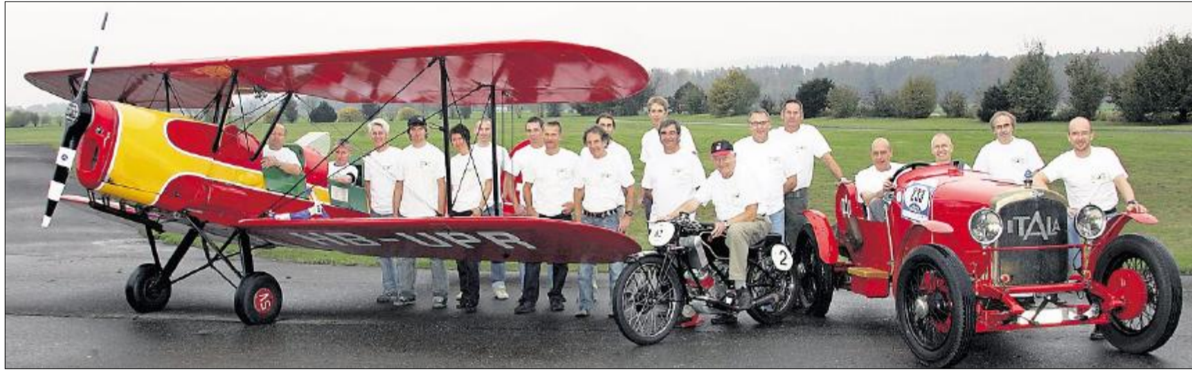
Das Team «Spirit of Albis» mit den historischen Fortbewegungsmitteln, die am 5. Juni an der Jungfrau-Stafette zum Einsatz kommen.

Jungfrau-Stafette Sportler aus dem Bezirk Horgen stecken in den letzten Vorbereitungen